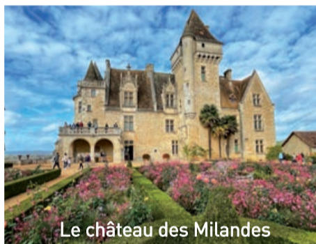
Le château des Milandes