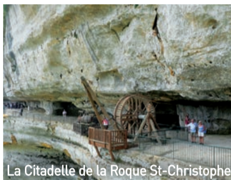
La Citadelle de la Roque St-Christophe