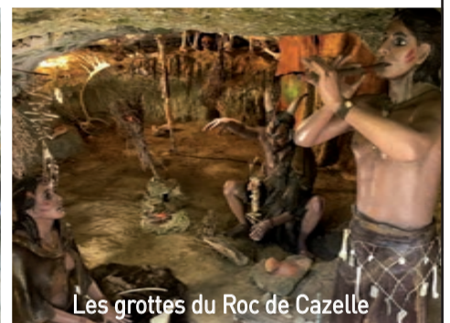
Les grottes du Roc de Cazelle