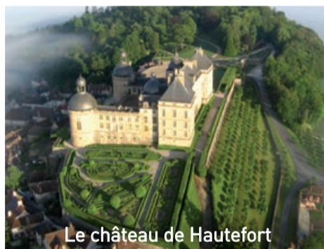
Le château de Hautefort