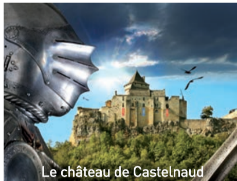
Le château de Castelnaud