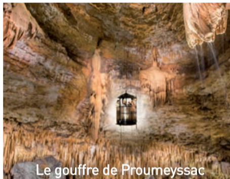
Le gouffre de Proumeyssac