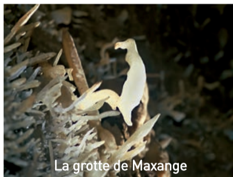
La grotte de Maxange