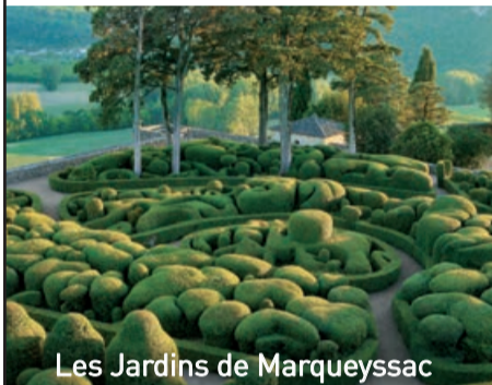
Les Jardins de Marqueyssac