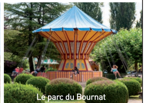
Le parc du Bournat