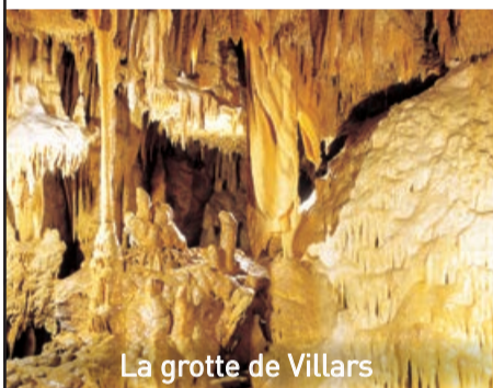
La grotte de Villars