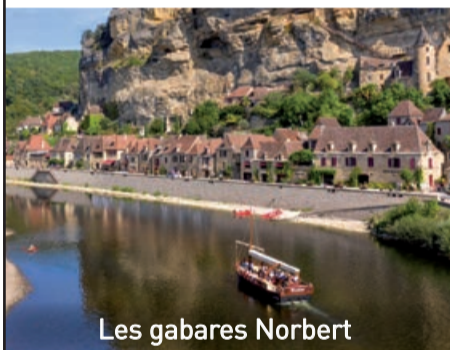
Les gabares Norbert