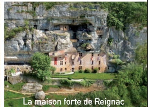
La maison forte de Reignac